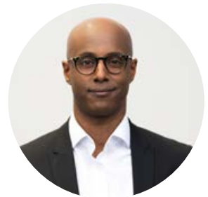
Abel Zere Leiter Interessenten- und Bewerbermanagement

Oder schreibe uns per WhatsApp 0049 170 5445514